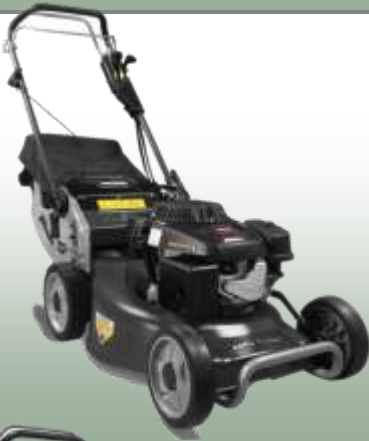
WB 507 SC V

Motor: Weibang Pro OHV 196 cc Elektrostart: nein Schnittbreite: 50 cm Radantrieb: 3-Gang Schaltgetriebe, Kardanwelle Gehäuse: Stahl Fangkorb: 60 L Mulchfunktion: ja