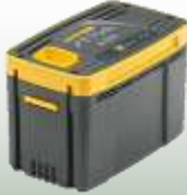
E 440 Kapazität: 4 Ah Ladezeit: 3 Std. 194,- €