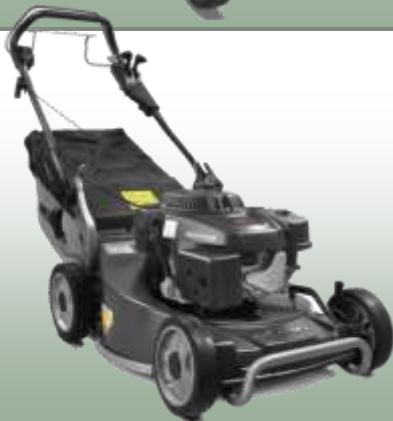
WB 537 SC V

Motor: Weibang Pro OHV 196 cc Elektrostart: nein Schnittbreite: 53 cm Radantrieb: 3-Gang Schaltgetriebe, Kardanwelle Gehäuse: Stahl Fangkorb: 70 L Mulchfunktion: nein