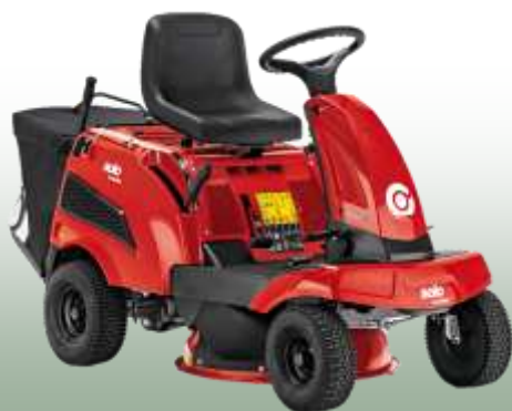
Rasentraktor R 7-65.8 HD

Motor: B&S 950 PXI, 1-Zylinder Schnittbreite: 62 cm Fahrantrieb: Hydrostat 2WD Vorderachse: Stahl Fangkorb: 130 L Mulchfunktion: nein