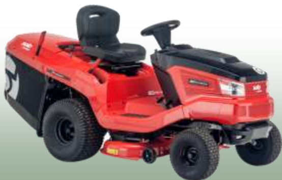
Rasentraktor T 22-105.1 HDD-A V2

Motor: AL-KO Pro 700, 2-Zylinder Schnittbreite: 105 cm Fahrantrieb: Hydrostat 2WD Vorderachse: Stahl Fangkorb: 310 L Mulchfunktion: ja