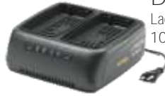
EC 415 D Doppel Ladestrom: 1,5 Ah 104,- €