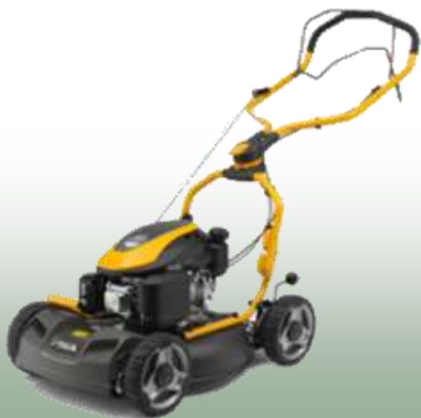
Multiclip 750 S

Motor: Stiga ST 170 OHV Autochoke Elektrostart: nein Schnittbreite: 48 cm Radantrieb: 1. Gang Gehäuse: verzinktes Stahlblech Fangkorb: 60 L Mulchfunktion: ja