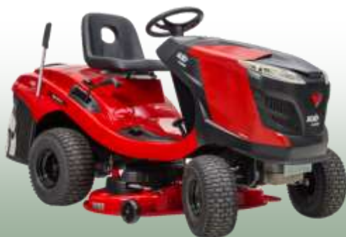
Rasentraktor T 15-93.3 HD-A

Motor: AL-KO Pro 450, 1-Zylinder Schnittbreite: 93 cm Fahrantrieb: Hydrostat 2WD Vorderachse: Stahl Fangkorb: 250 L Mulchfunktion: optional