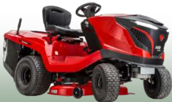
Rasentraktor T 18-105.4 HD-V2

Motor: B&S Intek 7160, 2-Zylinder Schnittbreite: 105 cm Fahrantrieb: Hydrostat 2WD Vorderachse: Stahl Fangkorb: 310 L Mulchfunktion: ja