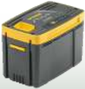
E 420 Kapazität: 2 Ah Ladezeit: 90 Min.