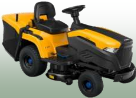
Estate 384 e

Akkukapazität: 48 V / 30 Ah / Lithium-Ionen Akku Ladezeit: ca. 2 Std. Schnittbreite: 84 cm Arbeitsfläche: bis 3000 m 2 Fahrantrieb: manuell Fangkorb: 240 L Mulchfunktion: ja, optional