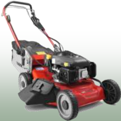
WB 506 SC VE 3-1

Motor: Loncin E-Start Elektrostart: ja Schnittbreite: 50 cm Radantrieb: variabel Gehäuse: Stahl Fangkorb: 65 L Mulchfunktion: ja