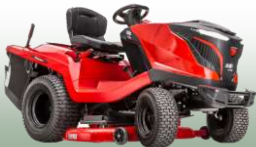
Rasentraktor T 22-105.4 HD-V2 SD

Motor: B&S Intek 7200, 2-Zylinder Schnittbreite: 105 cm Fahrantrieb: Hydrostat 2WD Vorderachse: Gusseisen Fangkorb: 310 L Mulchfunktion: ja