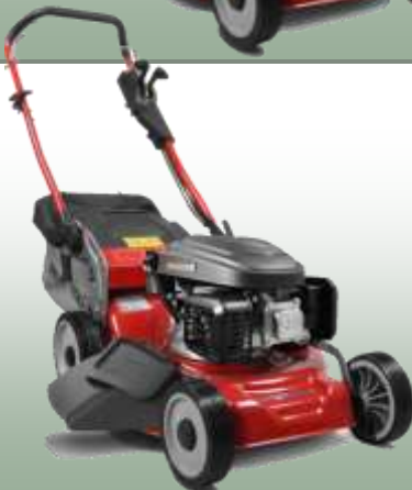
WB 456 SC V 3-1

Motor: Loncin 166cc Elektrostart: nein Schnittbreite: 45 cm Radantrieb: variabel Gehäuse: Stahl Fangkorb: 55 L Mulchfunktion: ja