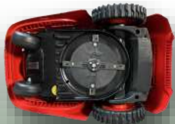
Messer mit feststehenden Klängen.