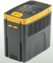
E 475 Kapazität: 7,5 Ah Ladezeit: 5 Std. 30 Min. 309,- €