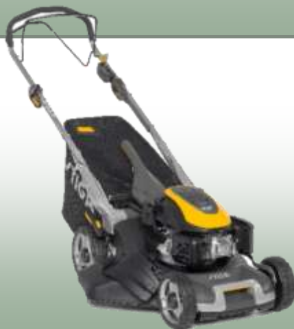
Twinclip 955 VE

Motor: GCVxe 170 OHV Autochoke Elektrostart: ja Schnittbreite: 53 cm Radantrieb: variabel Gehäuse: verzinktes Stahlblech Fangkorb: 70 L Mulchfunktion: ja