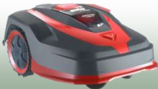
Robolinho 1423 W

Arbeitsfläche: bis 1400 m 2 Schnittbreite: 23 cm Klingen: 4 feste Klängen Mähzeit: 140 Min. Ladezeit: 90 Min. WLAN: ja