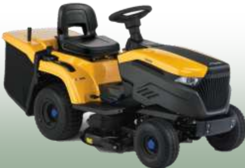
Estate 584 e

Akkukapazität: 48 V / 40 Ah / Lithium-Ionen Akku Ladezeit: ca. 3 Std. Schnittbreite: 84 cm Arbeitsfläche: bis 4000 m 2 Fahrantrieb: stufenlos Fangkorb: 240 L Mulchfunktion: ja, optional