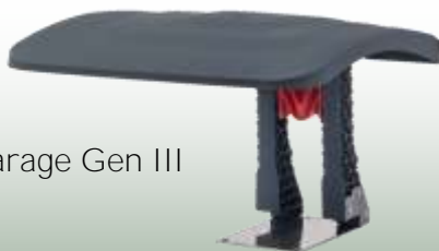
Garage Gen III