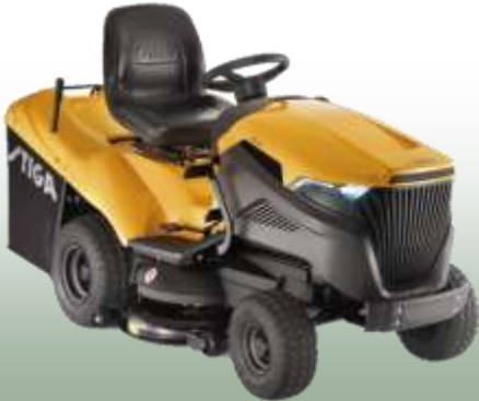
Estate 7102 W

Motor: Stiga ST 650 Twin, 2-Zylinder Schnittbreite: 102 cm Fahrantrieb: Hydrostat 2WD Vorderachse: Gusseisen Fangkorb: 300 L Mulchfunktion: optional