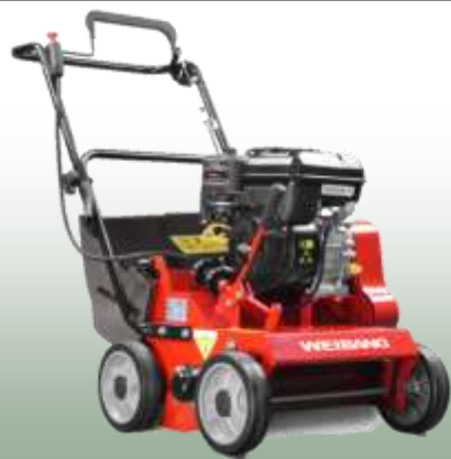
WB 384 RB AL

Motor: B&S 750 OHV Serie Elektrostart: nein Schnittbreite: 38 cm Radantrieb: nein Gehäuse: Stahl Fangkorb: 40 L Vertikutiersystem: Pendelmesser