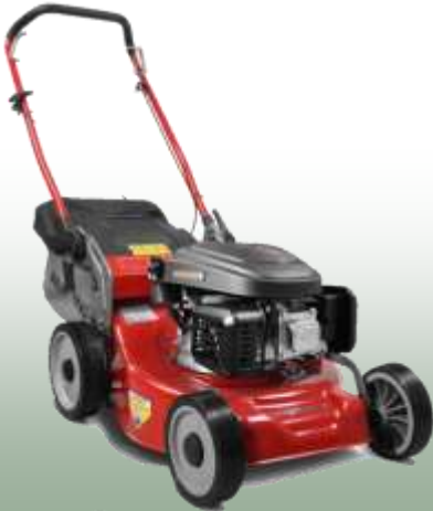
WB 456 HC

Motor: Loncin 166cc Elektrostart: nein Schnittbreite: 45 cm Radantrieb: nein Gehäuse: Stahl Fangkorb: 55 L Mulchfunktion: optional