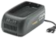
EC 415 S Standard Ladestrom: 1,5 Ah 64,- €