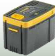
E 450 Kapazität: 5 Ah Ladezeit: 3 Std. 40Min. 229,- €