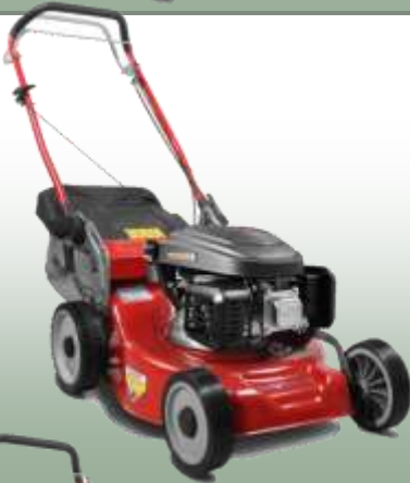
WB 456 SC

Motor: Loncin 166cc Elektrostart: nein Schnittbreite: 45 cm Radantrieb: 1. Gang Gehäuse: Stahl Fangkorb: 55 L Mulchfunktion: optional