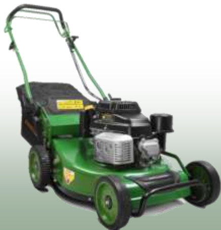
WB 536 SK GL

Motor: Kawasaki FJ 180 mit Ölpumpe Elektrostart: nein Schnittbreite: 53 cm Radantrieb: konstant 3,52 km/h Gehäuse: Stahl Fangkorb: 70 L Mulchfunktion: optional